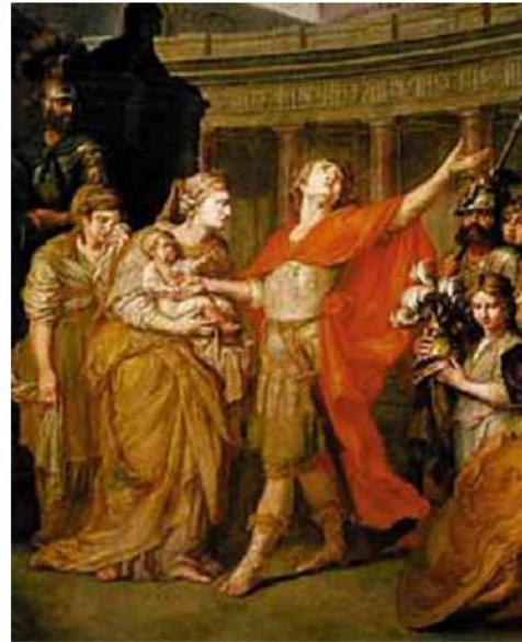
А. Лосенко. Прощання Гектора з Андромахою. 1773 р. Фрагмент

Гектору притаманні звичайні людські почуття. Опинившись віч-на-віч з розлюченим Ахіллом, він лякається, потім намагається домовитися з ворогом про те, щоб тіло загиблого переможець віддав для поховання близьким. Та коли засліплений гнівом Ахілл знущається з його пропозиції, Гектор позбувається страху й невпевненості. Утрапивши списи й розуміючи, що доведеться загинути, троянець відчайдушно нападає на ворога з мечем, являючи приклад героїчного життя і славної смерті.